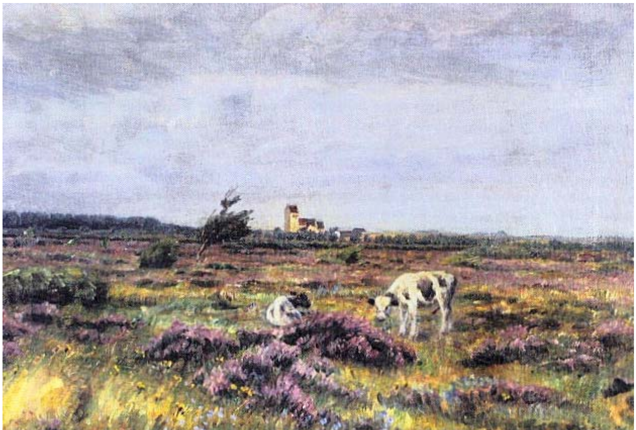
N. P. Mols 1912, Sandflugtsplantagen og Rørvig Kirke

En spændende mulighed for tværfaglig undervisning i klassen og i verden udenfor!